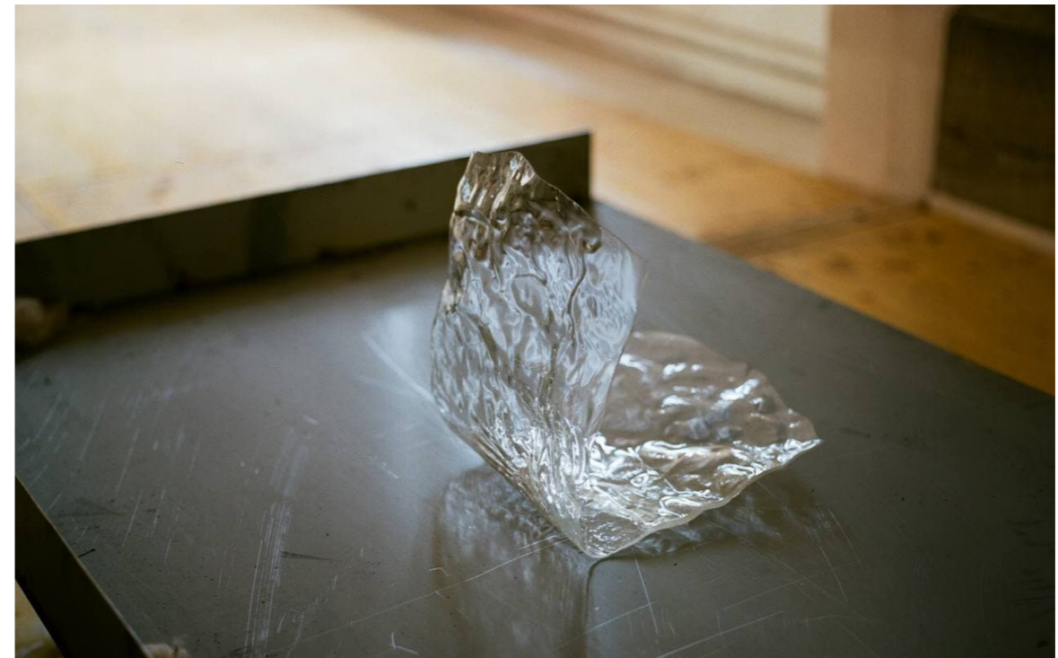
©mountaincutters, vue de l'exposition Du pouce jusqu'à l'auriculaire , co-production Espace Croisé et Fondation Martel", 2021

1 Cette notion de paradoxe est bien mise en évidence dans la présentation donnée par Guillaume Désanges, mountaincutters : Le désordre des choses, Prix des amis du Palais de Tokyo, le 13 octobre 2020.