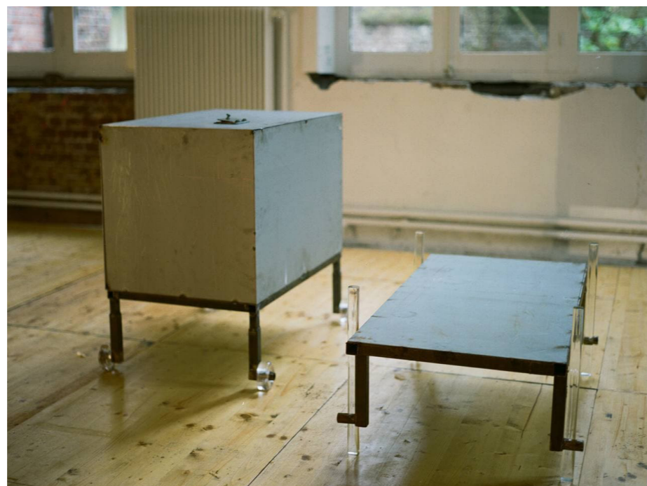
©mountaincutters, vue de l'exposition Du pouce jusqu'à l'auriculaire , co-production Espace Croisé et Fondation Martel", 2021