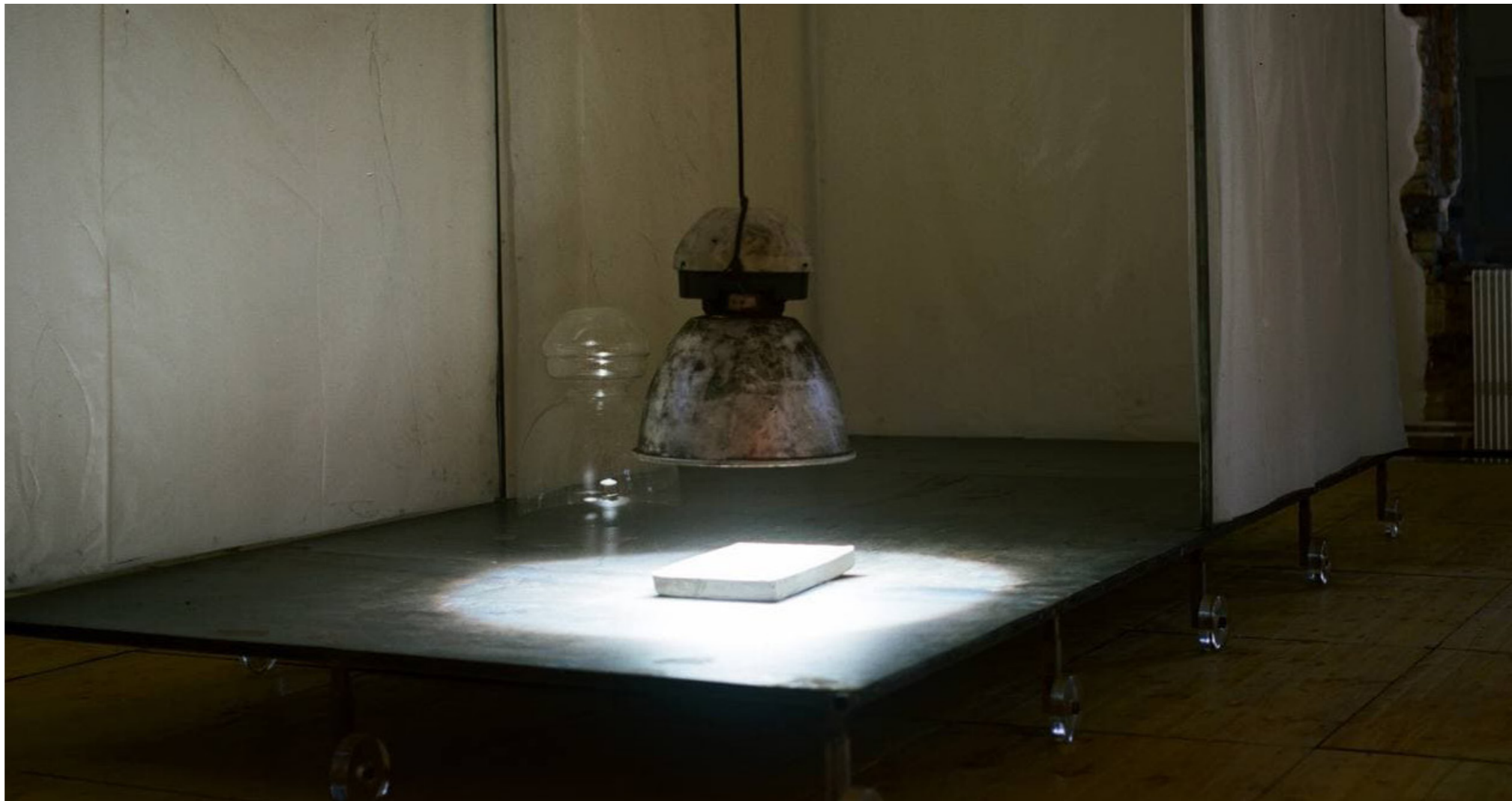
©mountaincutters, vue de l'exposition Du pouce jusqu'à l'auriculaire , co- production Espace Croisé et Fondation Martel", 2021